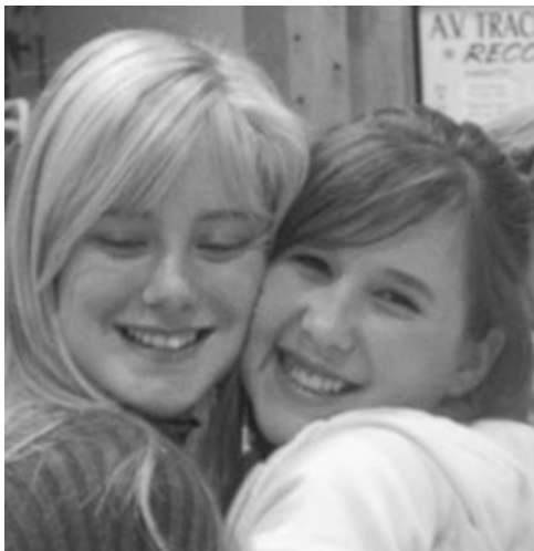
Prevention Corner: Exuberant high school students hug after Challenge Day experience.

BULK RATE U.S. POSTAGE PAID Boonville, CA Permit No. 9