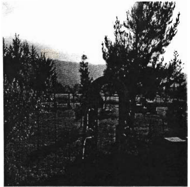
El foro de comunidad anual va a pasar en el 17 de octubre a las una en el parque cerca la clinica.

Si quiere más información en como proteger a su vecindad del crimen, incluyendo a las drogas, favor de llamar a Gregory a 895-3646 o a 684-0043