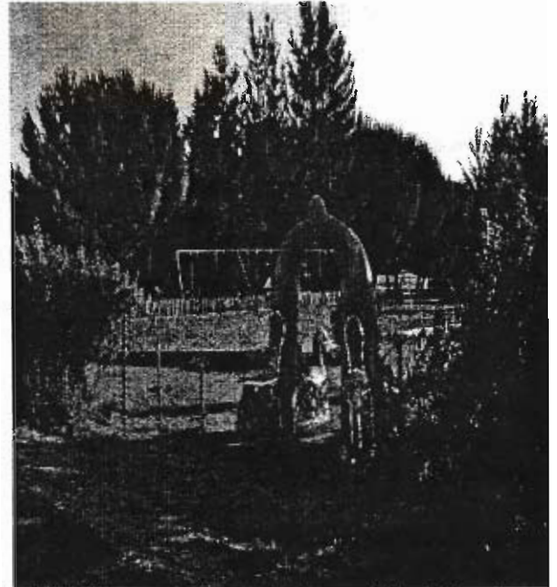
AVCAC's annual Community Forum will be held on Oct. 17th at the Community park at 1 PM.

If you would like more information on getting involved in protecting your neighborhood from crime, including drug activity, call Gregory at 895-3646 or 684-0043.